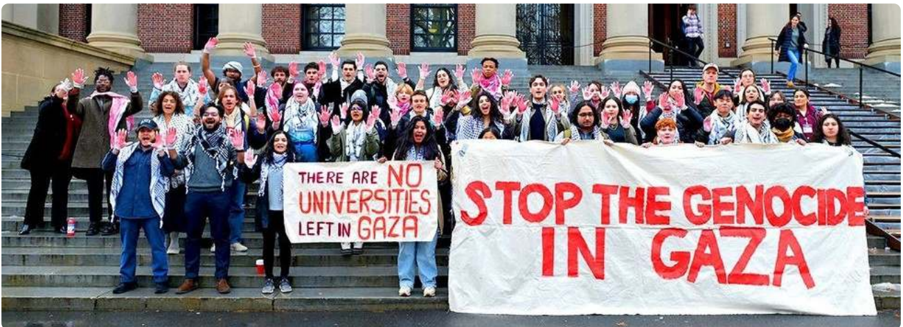
"Állítsák meg a népirtást Gázában" tiltakozás a Harvard Egyetemen

Az Egyesült Államokban több mint 130 egyetem 45 államban tiltakozott Izrael gázai katonai akciói ellen, köztük a Harvard Egyetem elnöke, Claudine Gay , aki jelentős politikai ellenállásba ütközött a tiltakozásokban való részvétele miatt.